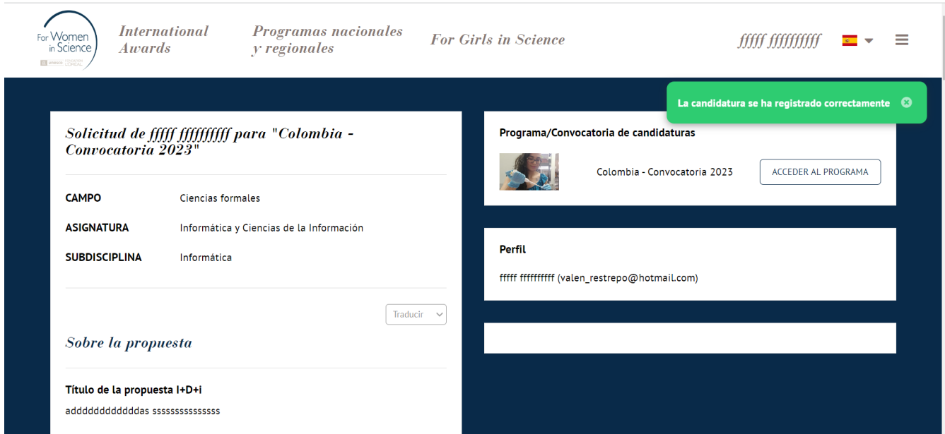
Figura N° 6: Pantalla de validación