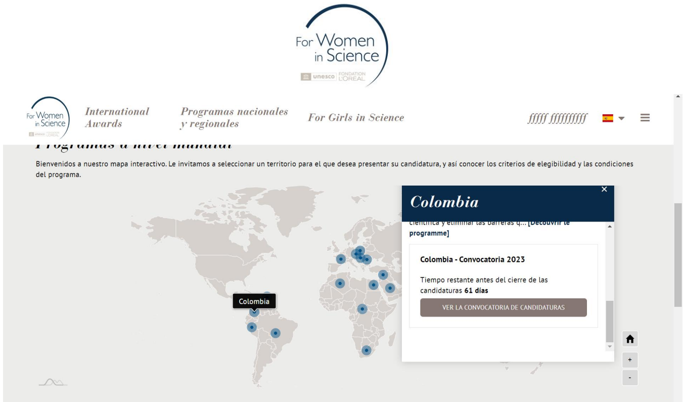
Figura N° 3 y 4: Pantalla de Selección de Programa- National and Regional Programs